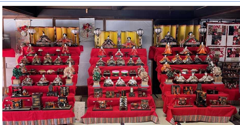
▲14日(水) 雛人形の飾り付け 15日からの展示公開に合わせて、多くのサポーターが集まって雛人形の飾り付けを行いました。昨年までの自粛した展示から、今年は保管している全ての人形を並べ、豪華な飾り付けになりました。