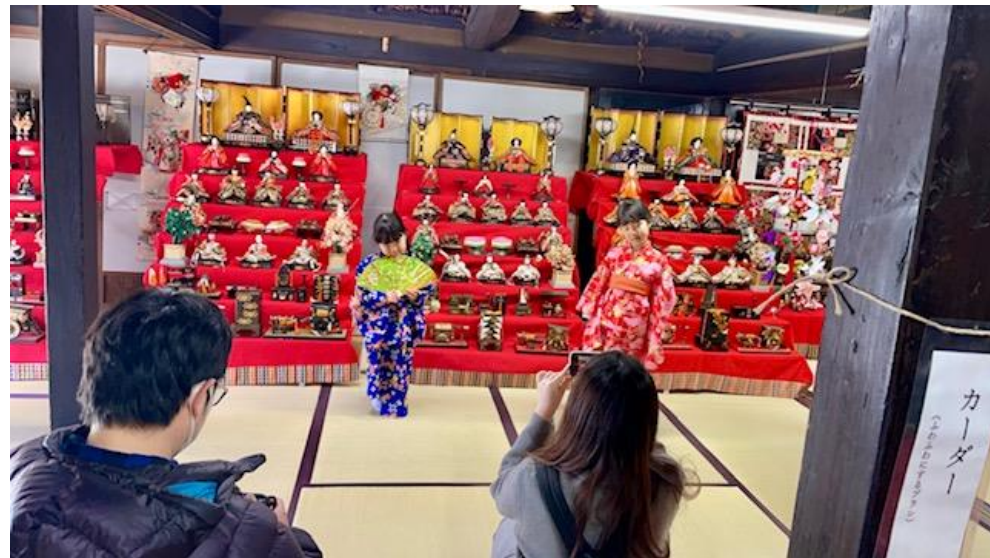
▲着物を着て、ひな人形の前で可愛らしいポーズを決めました。 笑顔のあふれる写真がたくさん撮れました。