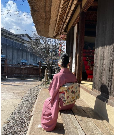
▲着物が映えるフотスポット 穏やかで暖かな縁側で、 素敵な1枚を撮影しました。