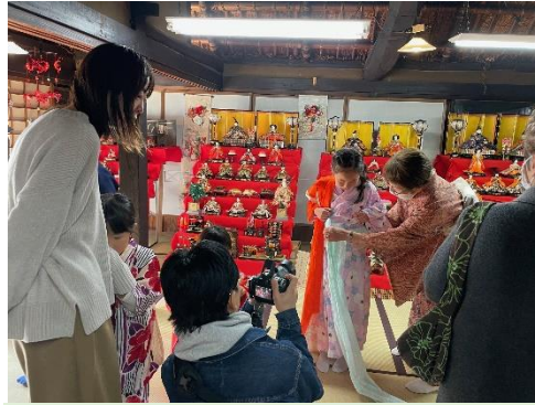
▲民家園にある子ども用の着物を 準備して、希望するお子様に 着付けをしました。