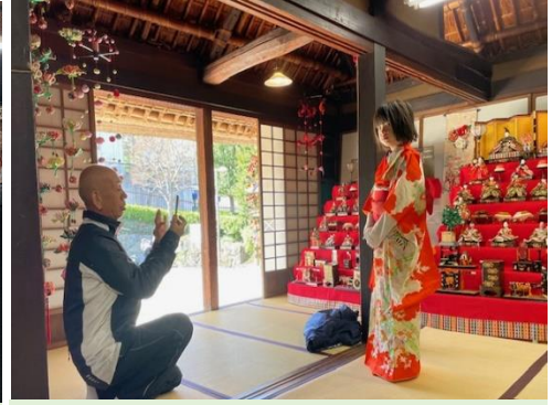
▲素敵にドレスアップできました。 夢中でシャッターを切るご家族 の姿がほほえましいです。