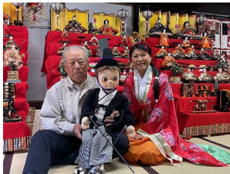
▲3日(日) 着物de民家園 腹話術のできるサポーターさん 着物で遊びに来てくれました。